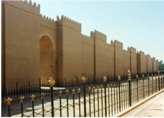
As muralhas reconstruídas da via processal se levantam das ruínas da antiga Babilônia.