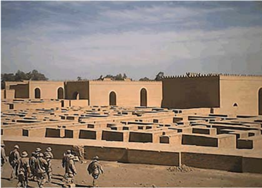
O palácio do Rei Nabucodonosor reconstruído.

Em Apocalipse 13:3-7, nos fala de uma cabeça ferida de morte: “ E vi uma de suas cabeças como ferida de morte, e a sua chaga mortal foi curada; e toda a terra se maravilhou após a besta. E adoraram o dragão que deu a besta o seu poder; e adoraram a besta dizendo: Quem è semelhante à besta? Quem poderá batalhar contra ela? E foi-lhe dada uma boca para proferir grandes coisas e blasfêmias; e deu-se-lhe poder para continuar por quarenta e dois meses. E abriu a sua boca em blasfêmias contra Deus, para blasfemar do seu nome, e do seu tabernáculo, e dos que habitam no céu. E foi-lhe permitido fazer guerra aos santos e vencê-los; e deu-se-lhe poder sobre toda tribo, e língua, e nação. ”