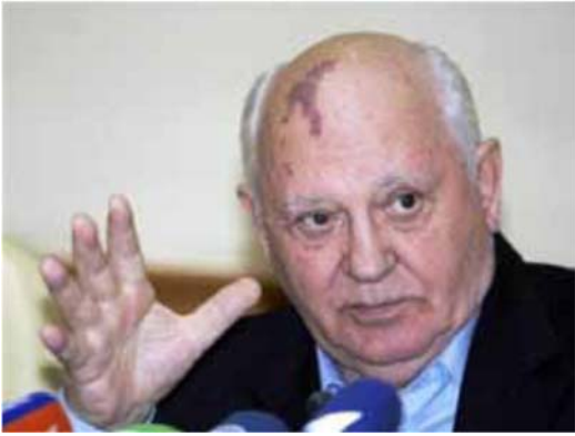
Mijail Gorbachov, premio Nobel da Paz de 1990 (Daniel 8:25)

Atualmente Boris Yeltsin se encontra no poder da Rússia com um estado físico muito delicado, por esse motivo, a palavra diz que será quebrantado sem ira e sem batalha.