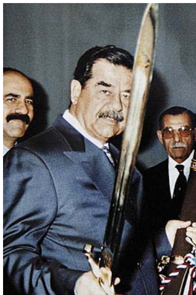
Saddam Hussein, atual presidente do Iraque. O falso profeta que menciona Apocalipse 19:20.

LA SEGUNDA ETAPA profetizada sobre esta nação, Iraque ou filha da Babilônia, se encontra na Bíblia em Jeremias 51:20-23, e nos diz que será martelo de toda a terra: “ Tu és o meu martelo e minhas armas de guerra; e contigo despedaçarei nações e contigo destruirei os reis; e contigo despedaçarei o cavalo e o seu cavaleiro; e contigo despedaçarei o carro e o que vai nele; e contigo despedaçarei o pastor e o seu rebanho; e contigo despedaçarei o lavrador e a sua junta de bois; e contigo despedaçarei os capitães e os magistrados.”.Em Apocalipse 17:9-10,